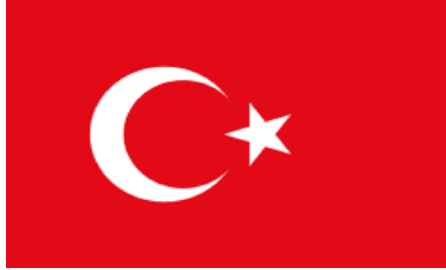
Şekil / Resim 1. İtalik ve Her Sözcüğün Baş Harfi Büyük Yazılmalıdır.